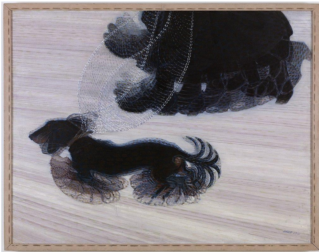
Slika 1: Giacomo Balla, Dinamika psa na povodcu, 1912, Albright-Knox_Art Gallery

Učencem pokažite nekaj del italijanskih futuristov