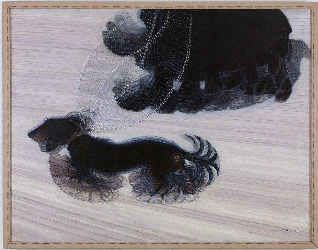
Kuva 1: Giacomo Balla, Dynamism of a Dog on a Leash , 1912, Albright-Knox_Art Gallery