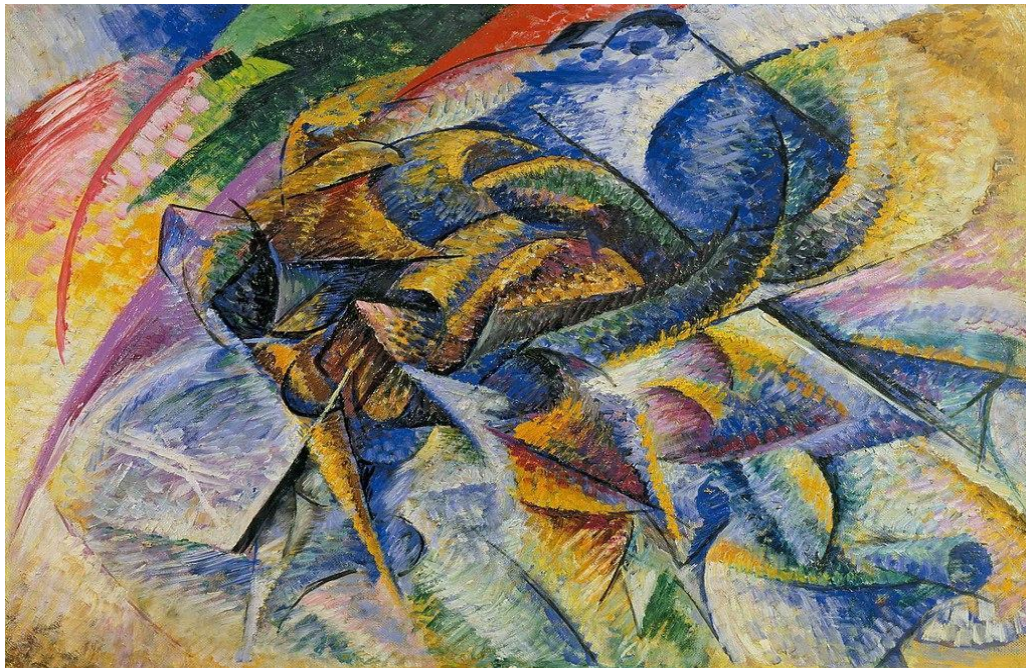
Kuva 2: Umberto_Boccioni, Dynamism of a Cyclist , 1913, Gianni Mattioli Collection